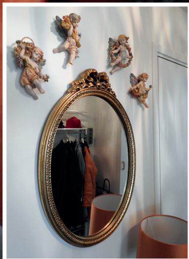
Änglar i olika former finns det gott om i Isakssons hem.