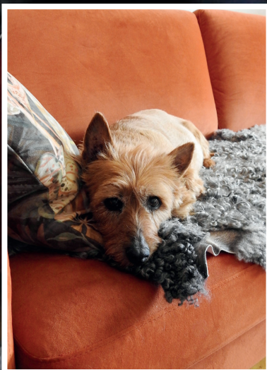
Vera, en kär familjemedlem, som trivs bra på fällan i soffan.