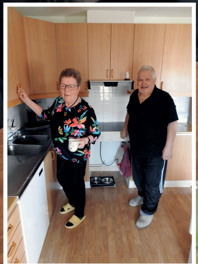
Det dukas upp till eftermiddagskaffe i köket.