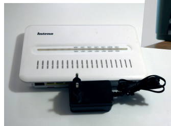
Switchen sitter oftast i skåpet i hallen.

OBS! Avsluta ditt elavtal hos Eon. Har du avtal hos Ålems Energi? Då säger vi upp det åt dig.