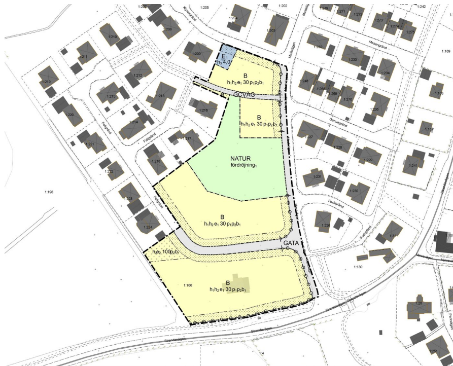
Utdrag ur plankartan. Kartan finns i större format på kommunens hemsida tillsammans med övriga handlingar.